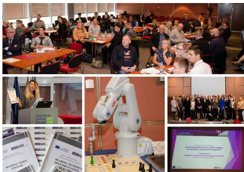
Medzinárodná konferencia skillME sa konala 4. októbra 2017 v Ľubľane v Slovinsku.

Cieľom konferencie bolo predstaviť osvedčené postupy a inovatívne prístupy pri vyplňaní medzier v zručnostiach, zosúladienie zručností s potrebami trhu práce, rozvoj nových zručností pre nové pracovné miesta, prispôbenie národných stratégií s cieľom zlepšiť kvalitu a efektívnosť odborného vzdelávania a prípravy a zvýšiť konkurencieschopnosť pracovníkov. Boli predložené rôzne prístupy k posilňovaniu odborného vzdelávania a prípravy v zúčastnených krajinách Slovinsku, Slovensku, Lotyšsku a Chorvátsku a národné stratégie implementácie učebných osnov navrhnutých do národných rámcov OVP v rámci projektu skillME. Školitelia a študenti okrem toho predstavili svoje konkrétne skúsenosti s implementáciou pilotných školení a preukázali ich využiteľnosť a výsledky. Ako príklad slúžilo školenie Machine Vision - používanie kamery na kontrolu robotov, ktoré prezentovali študenti Strednej odbornej školy Stará Turá. Viac informácií o konferencii nájdete na internetovej stránke projektu.